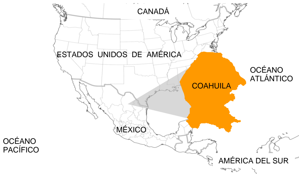
Ubicación de Coahuila de Zaragoza en Norteamérica.

Coahuila de Zaragoza es el tercer estado más grande del país, se encuentra localizado en el Noreste de México y comparte una frontera de 512 kilómetros con el estado norteamericano de Texas. En México, colinda con los estados de Chihuahua, Durango, Zacatecas, San Luis Potosí y Nuevo León.